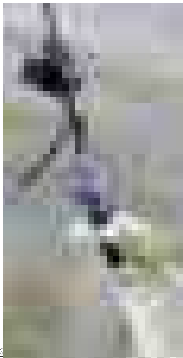
▲ La sonde Téléhydro de l'IRSN permet de mesurer, sur site et en continu, les radionucléides.

Autre difficulté : les portiques des CET ne sont